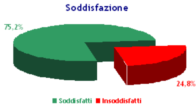
Distribuzione dei gradi di soddisfazione